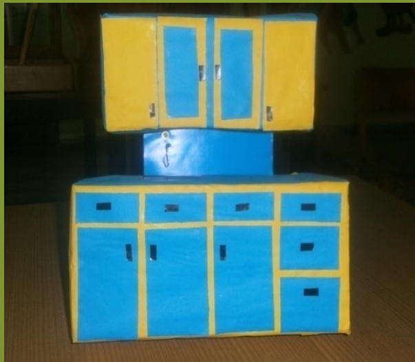
1. nagrada, 4. razred