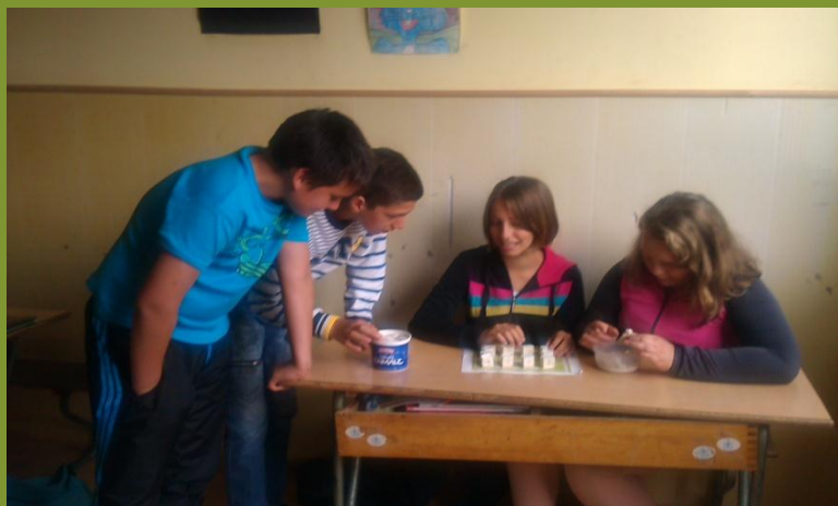
Verska nastava 6. razred