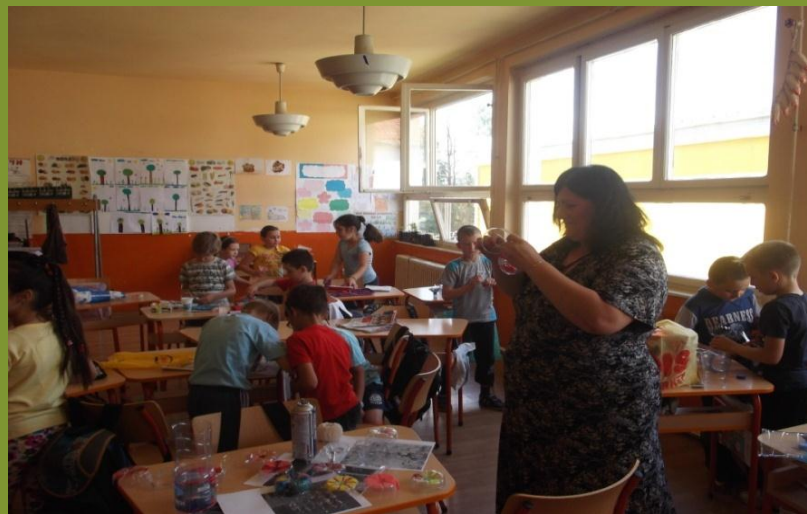
Svet oko nas 2. razred