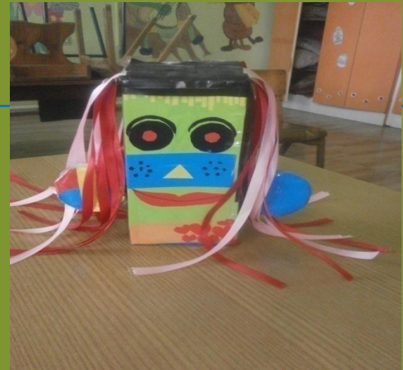
3. nagrada, 1. razred