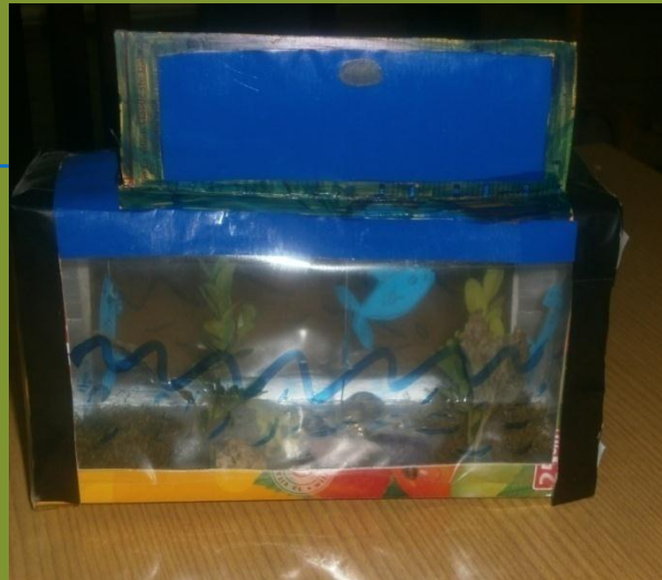
2. nagrada, 4. razred