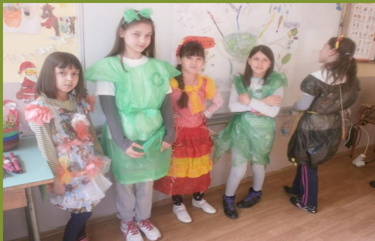
Priroda i društvo 3. razred