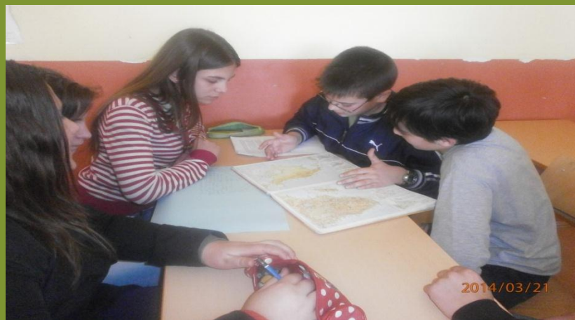
Hemija 8. razred