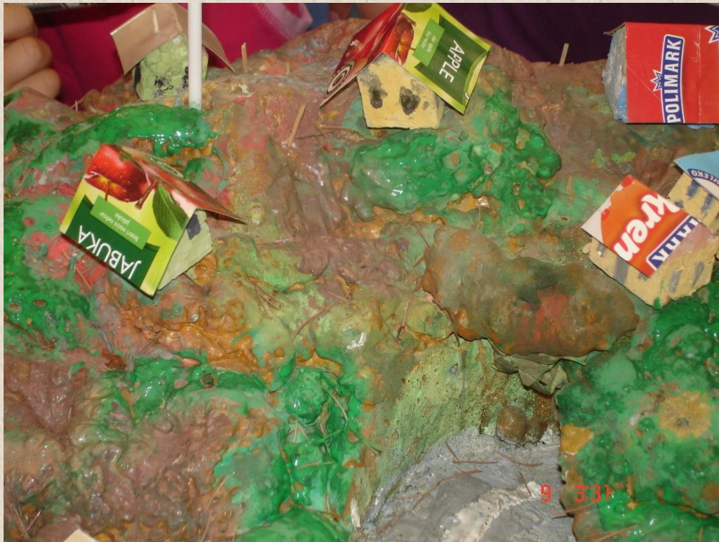
„Sakupljanje i sortiranje“