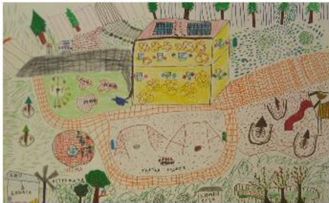
Заједнички цртеж: Еколошки вртић