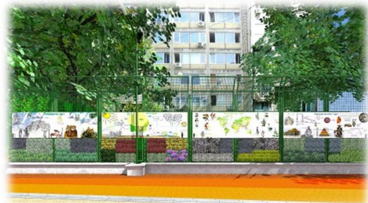
Дринка и „Екоист“