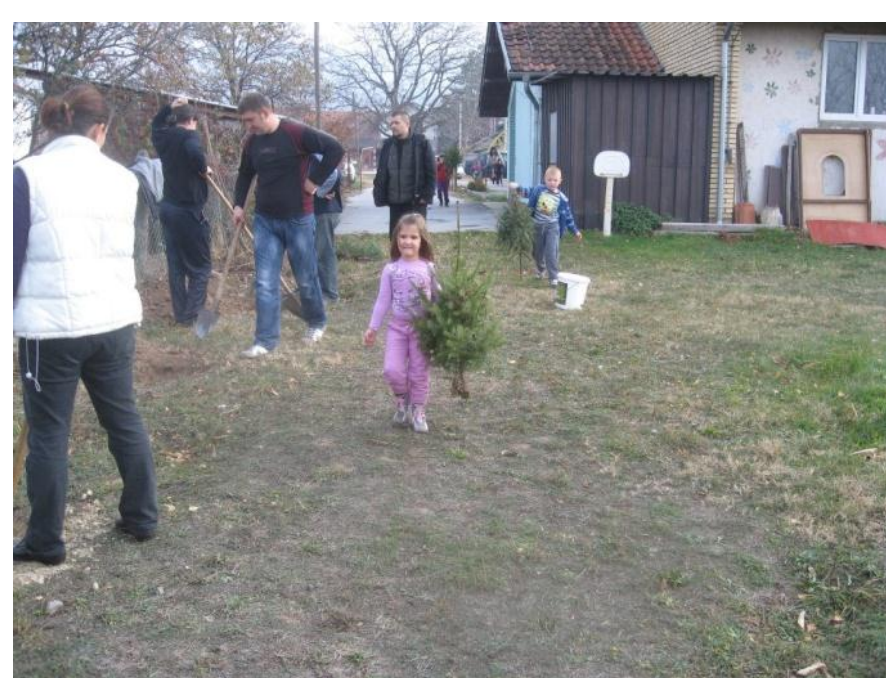
Међународни дан шума